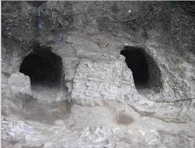
高尾横穴群 4号墓・5号墓