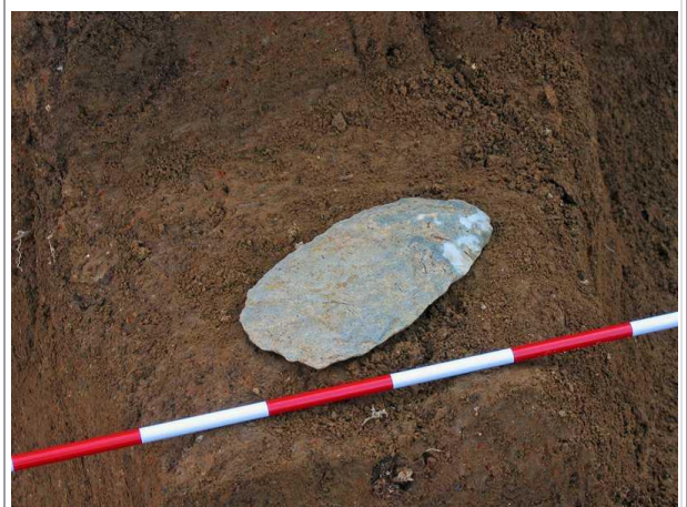
▲A区 B4層打製石斧出土状況