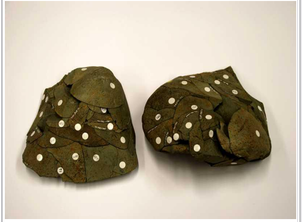
▲A区 出土石器接合資料

す。残念ながら完形にはなりません、同様の皿は3個体分の破片が発見されました。江戸時代の屋敷跡周辺からは、江戸時代前期～中期の陶磁器類が多く出土しており、優品も多いことから、家主は、遅くとも江戸時代初め頃からこの地に居を構え、かなりの有力者であったことが窺えます。