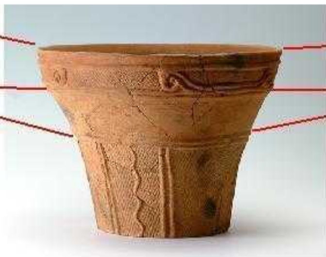
加曾利E 2 式 口縁部の区画に渦巻 頸の部分に無文帯