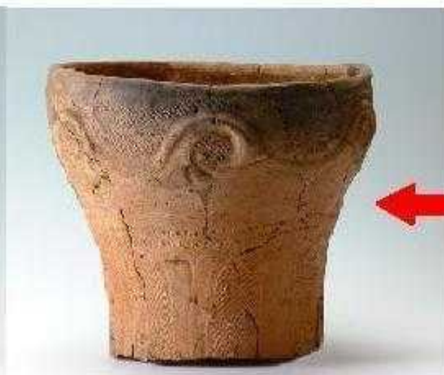
加曾利E 3 ~ E 4