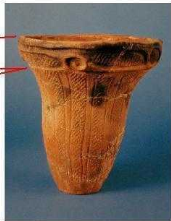
加曾利E 3 式 口縁部区画の渦巻 は維持するが 大まかになる 頸の無文帯消失 胴に描いた線の 間が無文化する