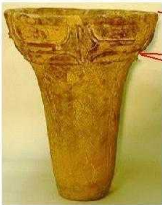
加曾利E 1 式 口縁部に区画 胴部に縄文と 棒で描いた縦の線