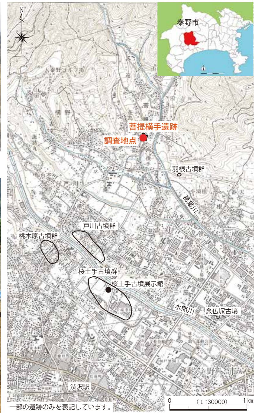
図 1 遺跡位置図