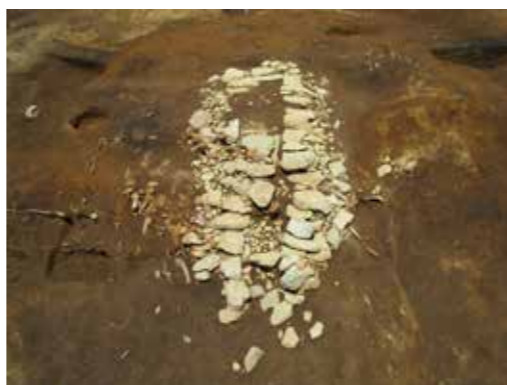
写真 5 2号墳石室検出状況