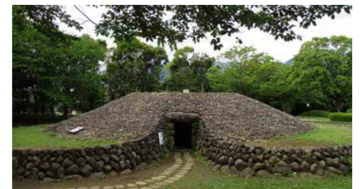
写真 7 桜土手古墳群の復元古墳