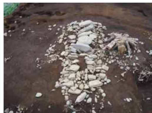
写真 4 1号墳石室検出状況