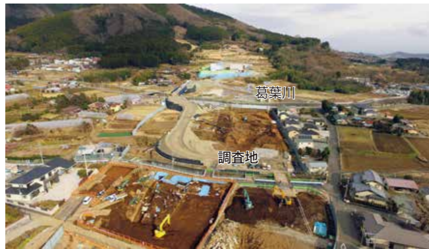
写真 2 調査地遠景