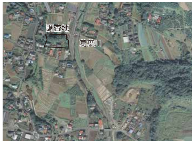
写真 1 調査地周辺空中写真

さらに調査地から、2 km 南の水無川沿いには県内でも有数の規模を誇る桜土手古墳群が位置しており、周囲にはいくつもの古墳群が点在しています。古墳時代の秦野盆地の様子を感じていただけたら幸いです。