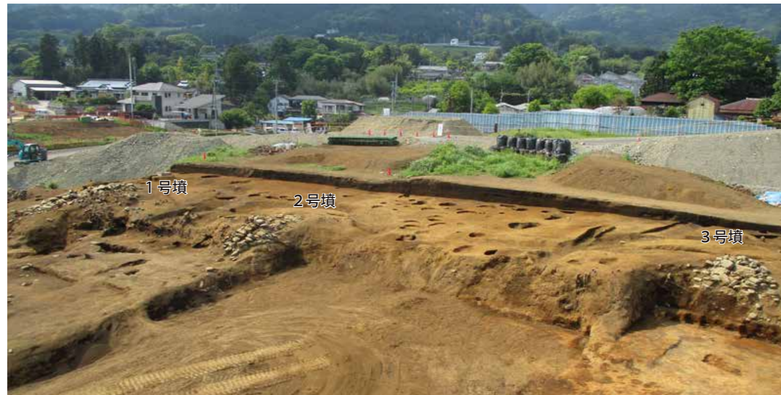
写真 3 1～3号墳全景