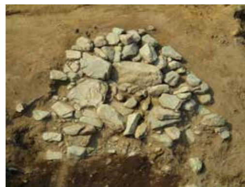
写真 6 3号墳石室検出状況