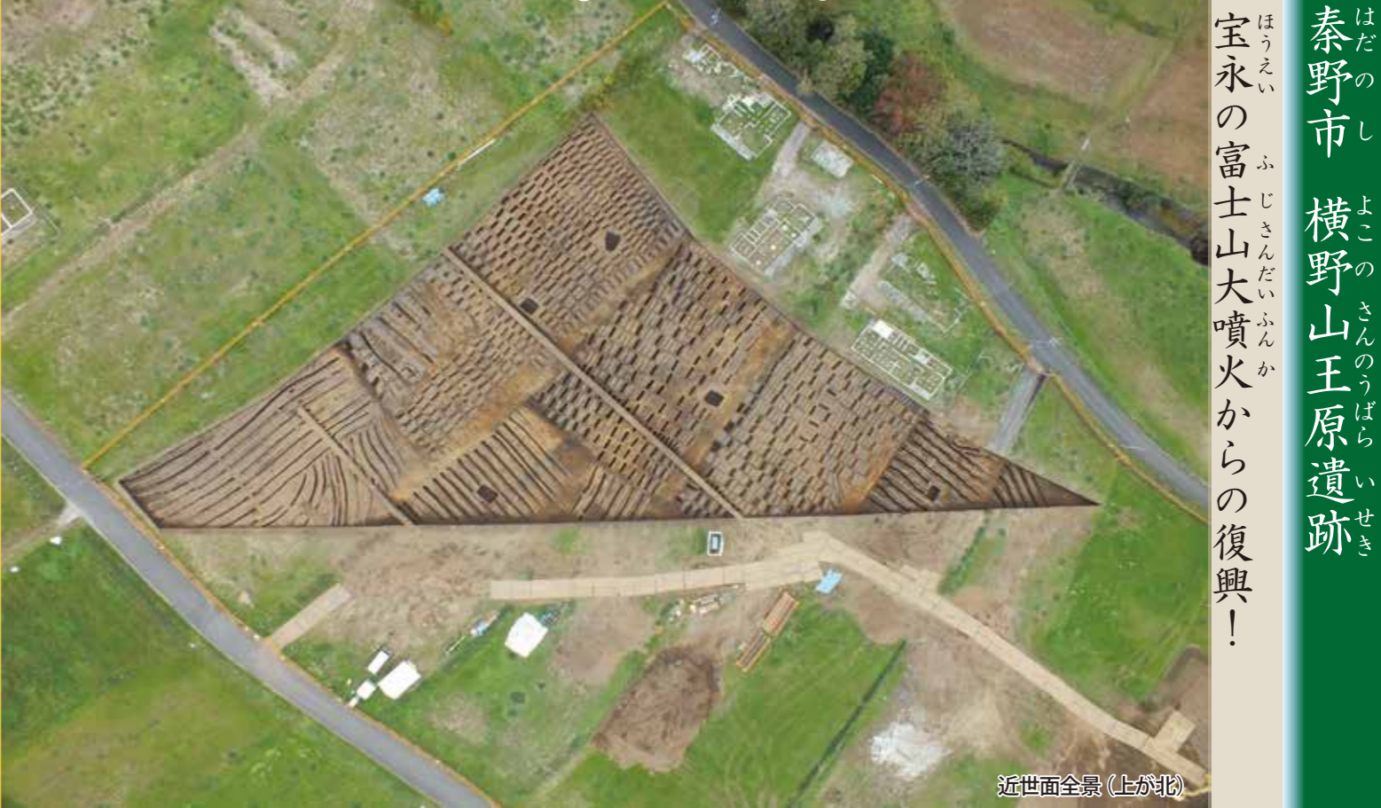
近世面全景(上が北)