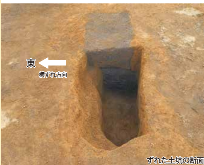
東 ← 横ずれ方向