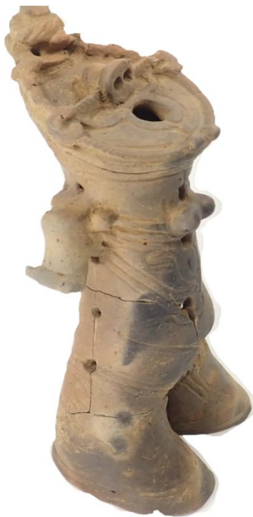
後期 中空土偶 側面から