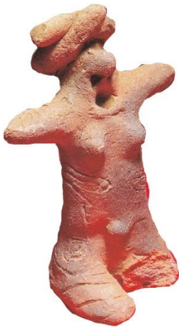
相模原市川尻中村遺跡 中期 土偶 （注1）