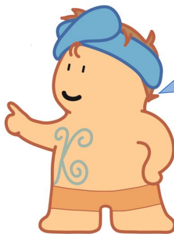
中期 土偶（鉢巻き土偶）（注1）

ぼくたちのモデルになった[鉢巻き土偶]（左写真・相模原市川尻中村遺跡出土）は中期後半（およそ 4,500 年前）の「中実土偶」なんだ。高さは 12 センチだから上の土偶とくらべるとずいぶん小さいね。