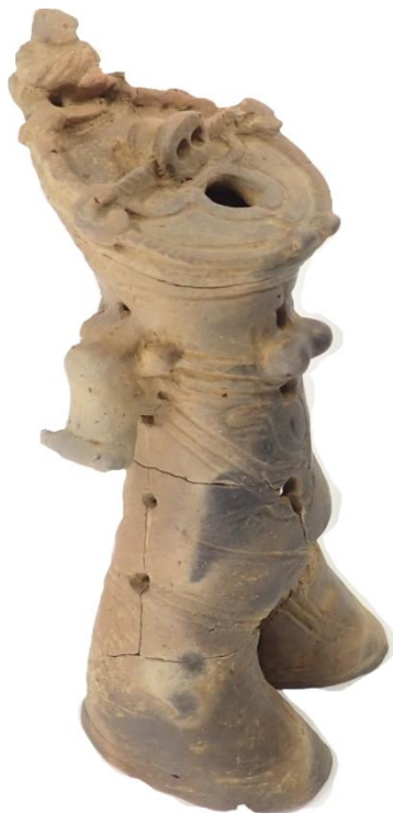
後期 中空土偶 側面から