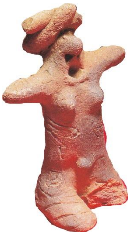
相模原市川尻中村遺跡