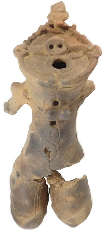
後期 中空土偶 正面