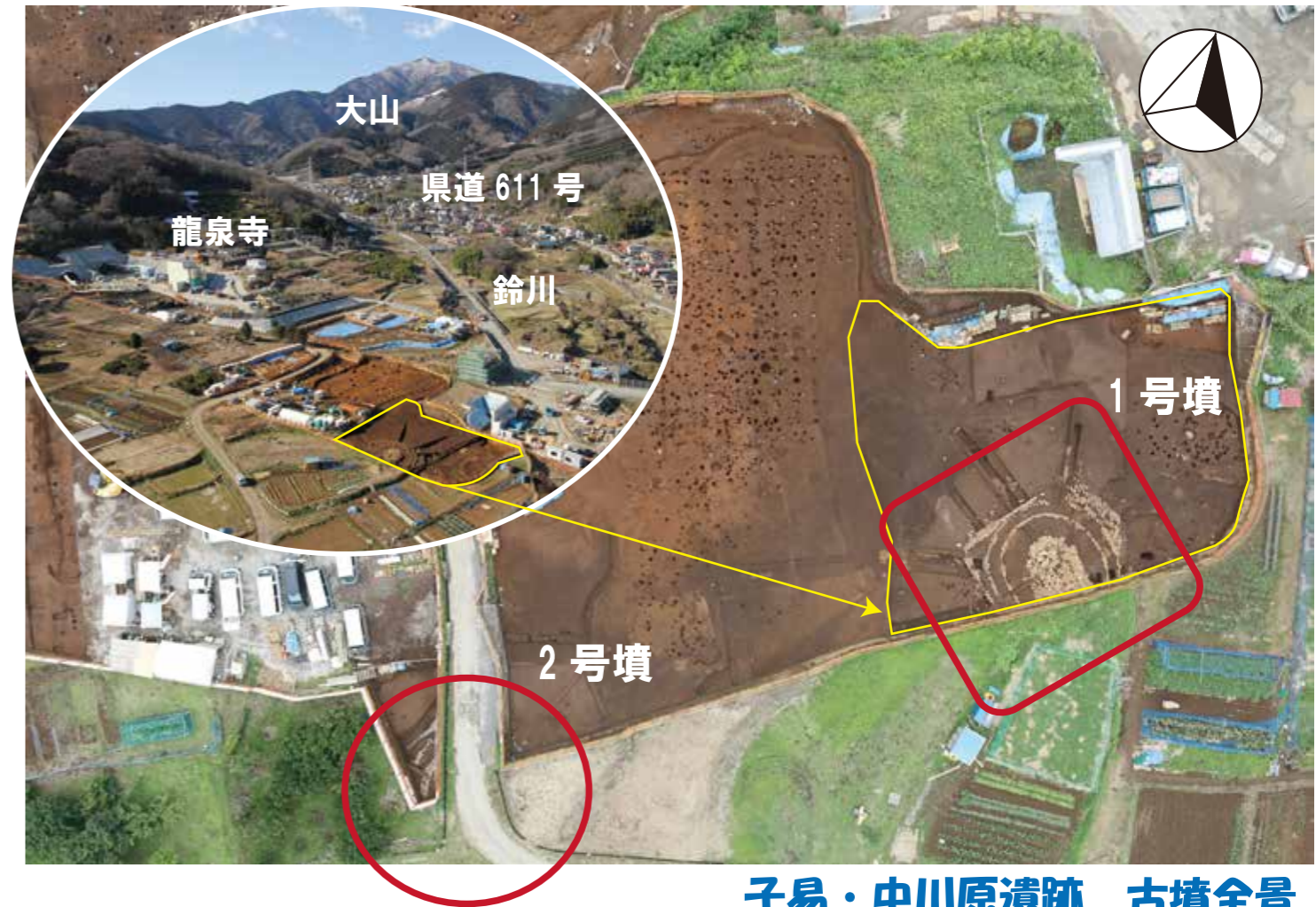
子易・中川原遺跡 古墳全景