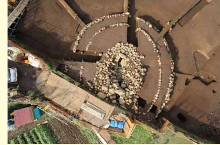
方形石積除去後の1号墳（上から）