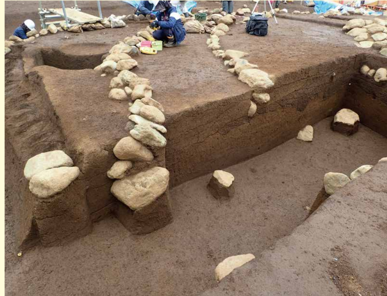
墳丘断面の様子（南から）