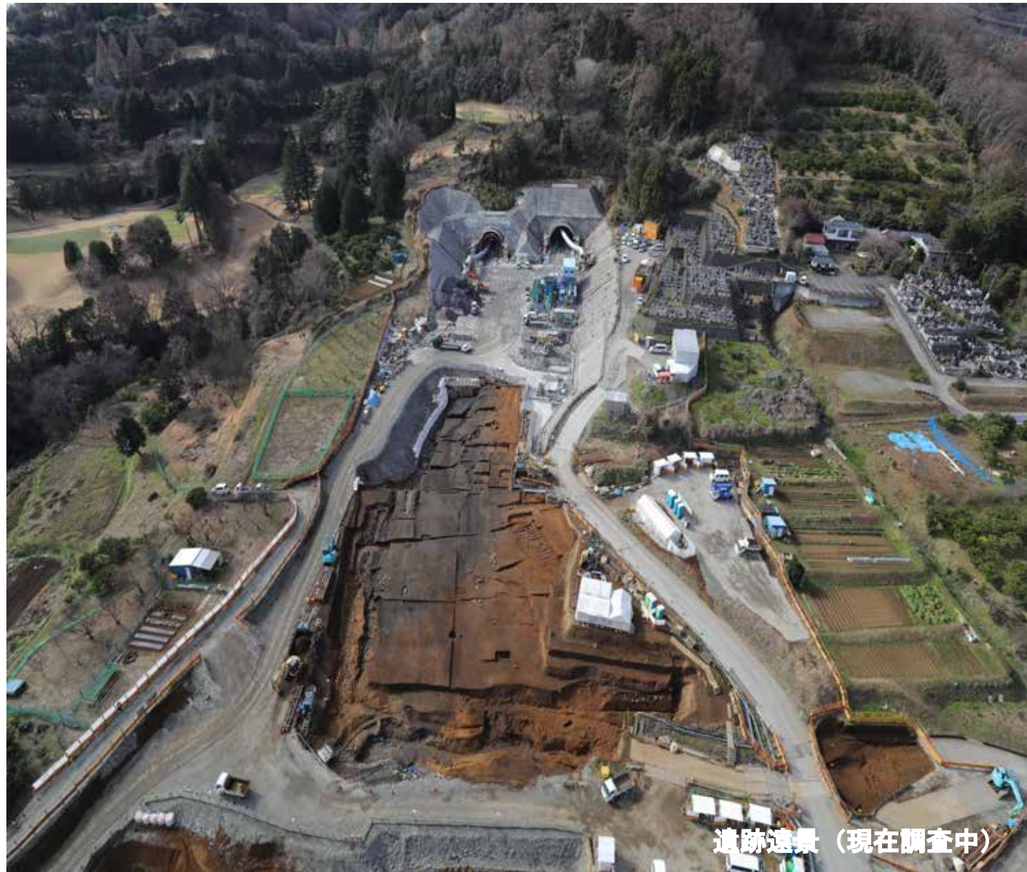
遺跡遠景（現在調査中）

伊勢原市子易地区に所在する子易・中川原遺跡は、新東名高速道路建設に伴い平成24年度から調査を継続しています。現在は3e工区+2工区残地から4-1④工区+5a工区にまたがる縄文時代～中世の埋もれた谷と縄文後期の集落（住居跡）などを調査しています。この谷地形は、縄文時代には周辺集落の水場として利用された可能性があり、弥生時代の河道も発見されています。中世には、埋もれた谷の上面に石を敷いた道路跡が見つかり、近世には畑地・水田となっています。このように、各時代にわたって谷地形を利用してきた様子が分かってきました。