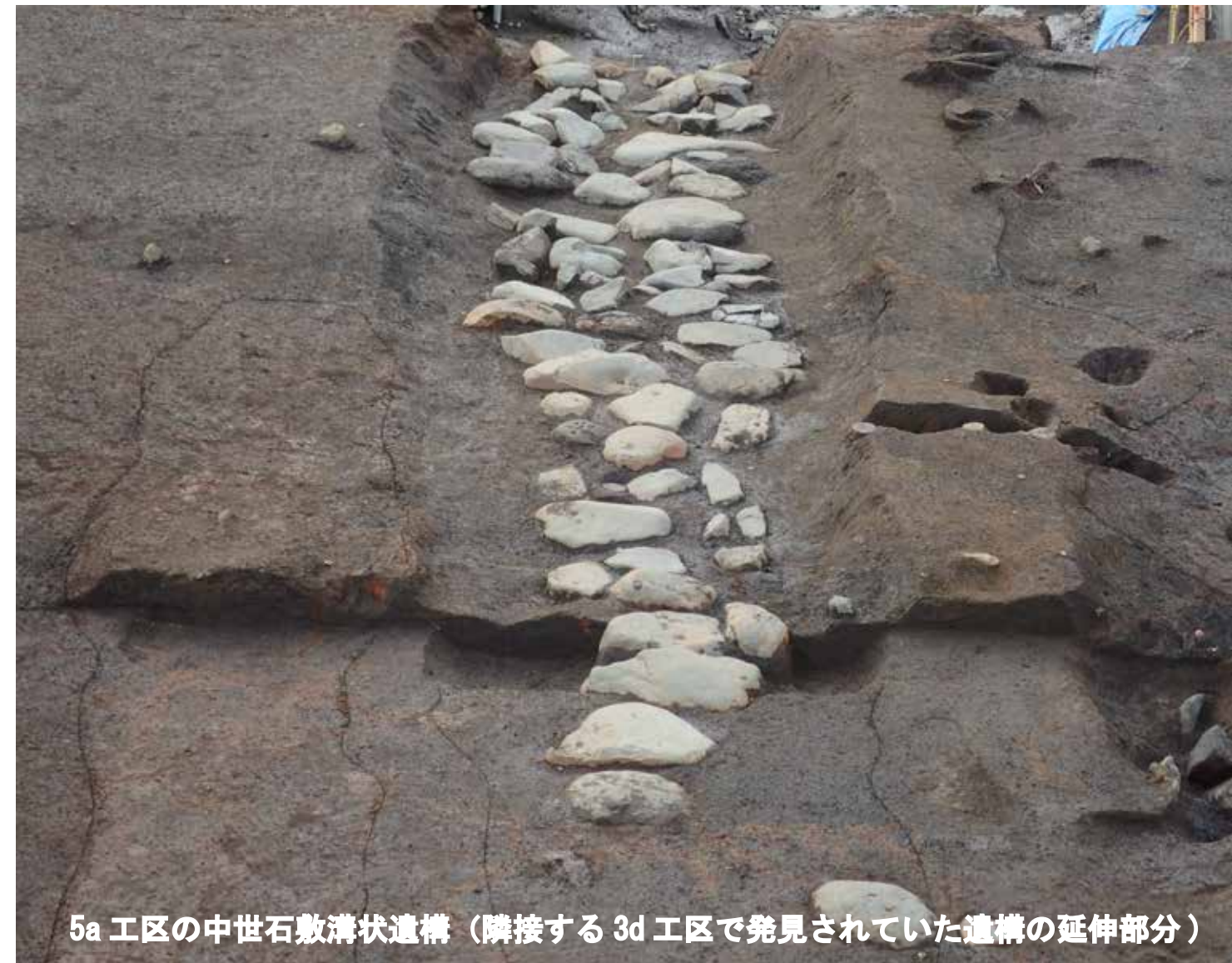
5a工区の中世石敷溝状遺構（隣接する3d工区で発見されていた遺構の延伸部分）