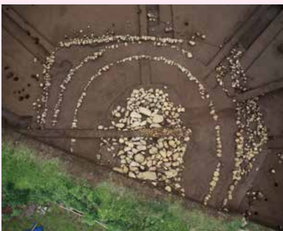
▲子易・中川原遺跡 6-3 工区 1号墳（方墳）（南東から）