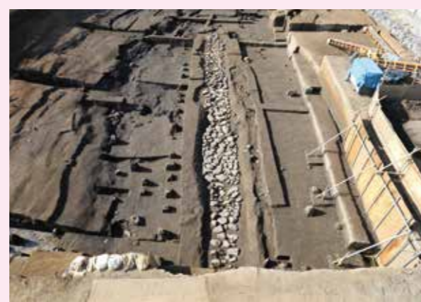
▲子易・中川原遺跡 3d 工区 中世石敷溝状遺構（東から）