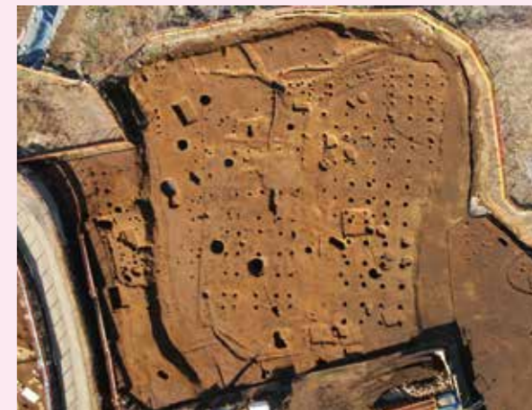
▲子易・中川原遺跡 6-2・6-3 工区 中世掘立柱建物群（屋敷跡）（南から）