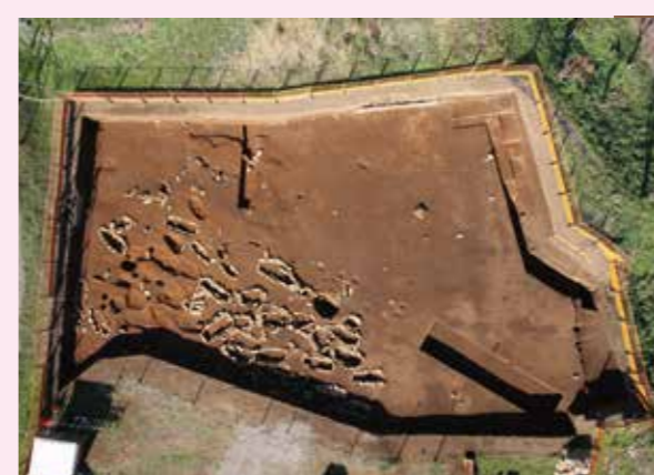
▲子易・中川原遺跡 4-2 工区東 縄文時代後期土坑墓・配石墓群（南から）