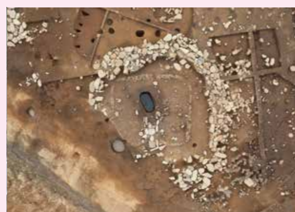
▲子易・中川原遺跡 4-1②工区 縄文時代後期敷石住居跡（南東から）