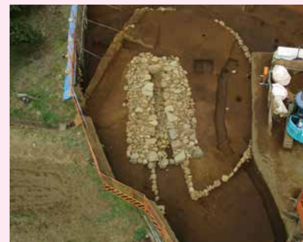
▲子易・中川原遺跡 4-1④・5d 工区 2号墳（円墳）（南東から）