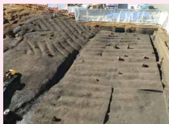
▲子易・中川原遺跡 3c 工区 奈良・平安時代畝状遺構（東から）