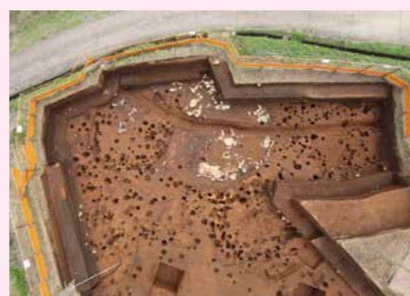
▲子易・中川原遺跡 4-2 工区西 縄文時代後期集落（北西から）