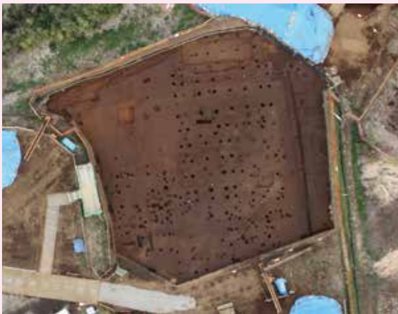
▲子易・中川原遺跡 6-1 工区 中世掘立柱建物群（屋敷跡）（南から）