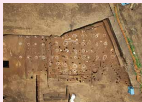
▲子易・中川原遺跡 1-1・1-2 工区 中世礎石建物群（寺院跡）（東から）