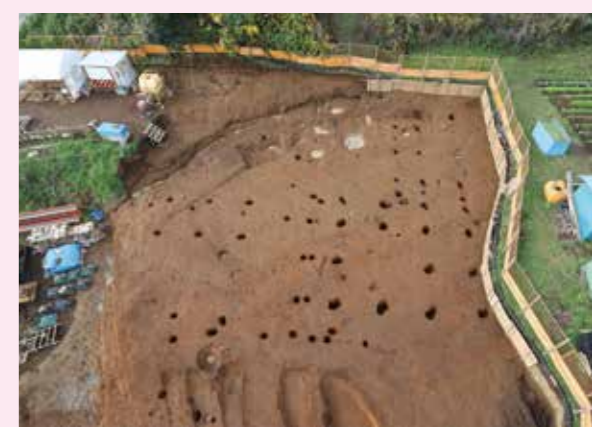
▲子易・中川原遺跡 4-1①工区 中世掘立柱建物群（東から）