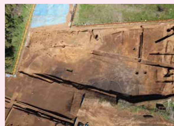
▲子易・中川原遺跡 2 工区 中世池状遺構（南から）