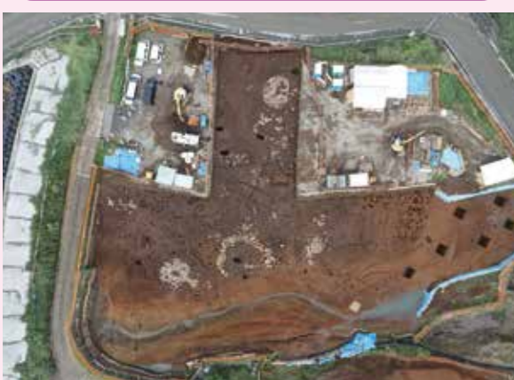
▲子易・中川原遺跡 4-1②・5c 工区 縄文時代後期集落（南から）