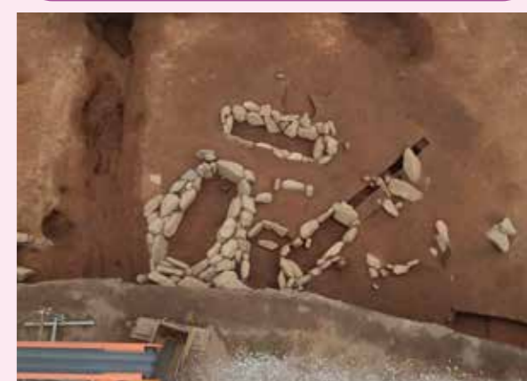
▲子易・中川原遺跡 4-1③工区 縄文時代後期配石墓群（西から）