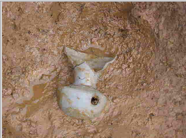
須恵須恵器出土状況