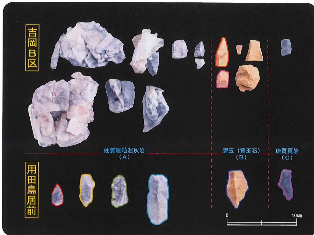
表紙背景写真:左上・右上 用田鳥居前遺跡/左下・右下 吉岡遺跡第2次調査B区/中央 吉岡・用田接合資料 裏表紙写真:吉岡・用田接合資料