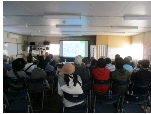
秦野市職員による学芸員トーク