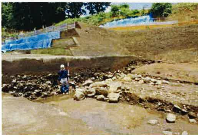
縄文時代～古墳時代の流路跡 (武蔵野ロームの上に1m以上の砂礫層が堆積している)

谷部では、地表から約5mの深さで縄文時代の流路跡が発見され、調査区の断面では幅10mほどの砂礫層がみとめられました。この流路は古墳時代まで変わらず、縄文時代と同じ場所を川が流れていたことが確認されました。このため縄文時代の遺構の大半は、弥生～古墳時代の川により壊されて失われたと思われます。また、渇水期には川は流路の中の狭い水路を流れており、縄文時代の水路の一部は台地から滑り落ちた立川ロームにより覆われていました。