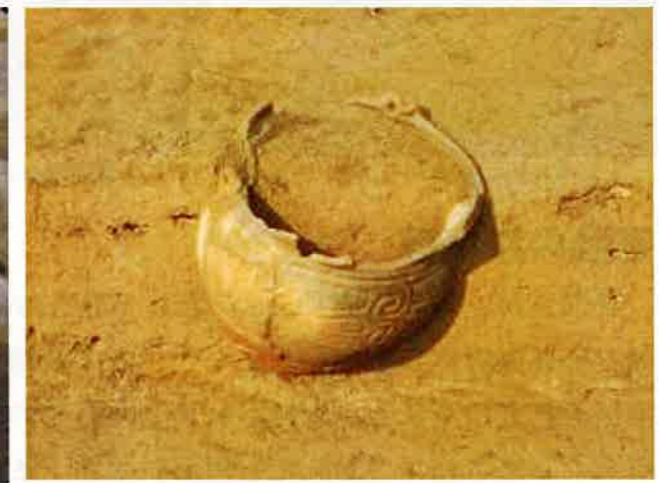
屋外の埋設土器（J1埋壺、後期前葉）