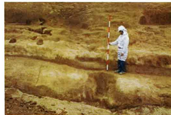
中段下斜面の通路跡（J1階段状遺構）