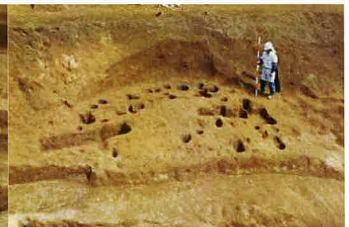
階段状遺構西側の敷石住居跡の掘り方（J1住）