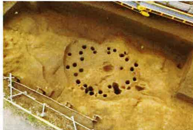
左の敷石住居跡の掘り方 (建替えの痕跡がある)