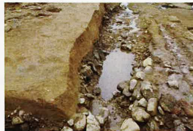
立川ロームに覆われた縄文時代の水路跡 (水路跡の砂礫層からは縄文土器が多量に出土した)