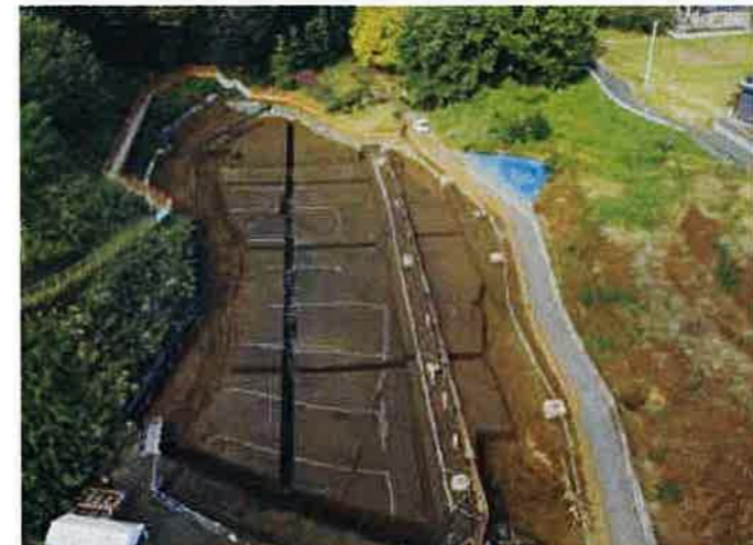
中世の水田跡 (傾斜地のため棚田状を呈する)

発見された遺構などから谷底の土地利用の変遷をみると、弥生時代と古墳時代では、縄文時代と同じ流路を川が流れ、このうち弥生時代では、農具等の原木と考えられるイチイガシの割材を水中で保管した木組み遺構が発見されました。また古代では、谷の埋積が進んで流路が狭くなり、明確な遺構は発見されませんが、流路から数点の完形土器 (土師器坏) がまとまって出土しました。その後、時代が下って中世になると、谷の両側に水路を掘って流水を管理し、水田耕作が行われました。しかし中世後半以降には、さらに谷の埋積と乾燥化が進んで日常的に水が流れる川がなくなったため、畑として利用されるようになり、現代に至っております。