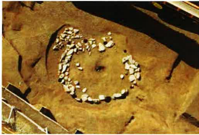
斜面下の敷石住居跡 (H28-J 1 住、後期初頭)