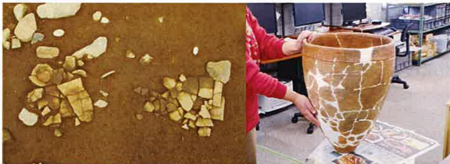
上の敷石住居跡の土器出土状態と復元土器