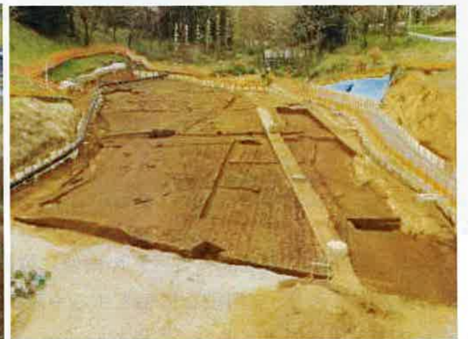
近世の畑跡 (宝永火山灰で覆われた畝状遺構)