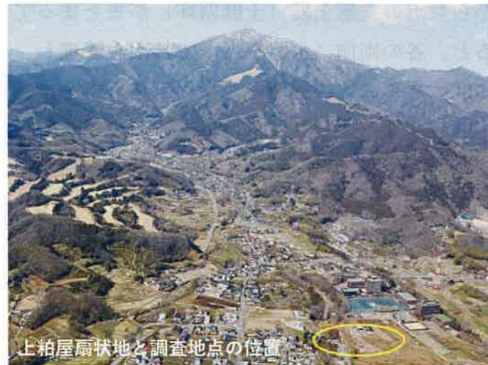
上粕屋扇状地と調査地点の位置

上粕屋扇状地は、大山を水源とする鈴川によって約6万年前に形成された台地で、神成松遺跡では、縄文時代以降に堆積した黒土層の下に立川ロームと武蔵野ロームが約16mの厚さで堆積しています。この台地は、南北約3km、東西1.5kmの広がりを持ち、東西に流れる二三の小河川によって南北に分断されています。調査地点南側2区の谷もその一つで、谷底の発掘調査によって、約4万年前に武蔵野ロームを削って川が流れた流路跡（立川礫層）とその上に立川ロームが堆積した立川段丘が確認されました。今回の調査地点3区と2区上段は武蔵野段丘に相当し、それより数m低い中段が立川段丘に相当します。この谷は、上流の北西に遡ると上粕屋子易遺跡付近まで続き、鈴川の旧流路をもとに川が流れて形成されたと推定されます。