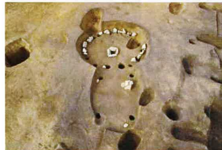
上段から発見された敷石住居跡（J2住、後期前葉）

上段の緩斜面からは、中期末から後期前葉の敷石住居跡が3軒点在して発見され、貯蔵穴の可能性のある土坑や屋外の埋設土器なども発見されています。敷石住居跡のうち2軒は、壁際に縁石を配置しただけ、あるいは中央の敷石を除去した状態で発見されています。また、中段の平坦面は狭小なこともあり、縄文時代の遺構は発見されておきませんが、下段に移行する斜面から埋設谷が確認されました。そして、埋設谷の中央からは南側の谷に下りる通路と思われる階段状遺構が発見され、その両脇の斜面には2軒の住居跡が構築されていました。東側の住居跡は出土遺物がなく時期は判明しませんが、西側の住居跡は後期前葉の敷石住居跡であり、ともに近世の段切り造成（下段）により奥壁部分を残して壊されています。さらに、斜面下の谷部からも後期初頭の敷石住居跡が1軒発見され、住居跡の下層から中段下の階段状遺構に続くと思われる溝状の遺構が発見されました。この遺構は、台地上から谷底に下りる通路と推定され、出土土器から中期後葉に作られたと考えられます。このように、神成松遺跡では、台地上と南側斜面に住居を作り、川が流れる谷底を含め広範囲に活動を行っておりました。