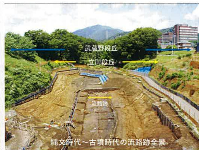
縄文時代～古墳時代の流路跡全景