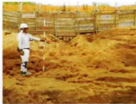
斜面下の溝状の通路跡