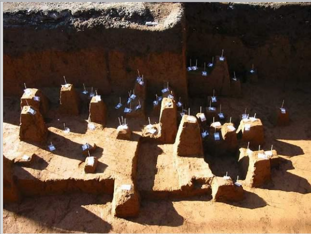
風間遺跡 旧石器 遺物出土状況