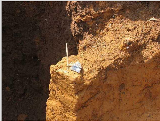
風間遺跡 旧石器 石器出土状況