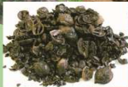
出土したクルミとトチの実