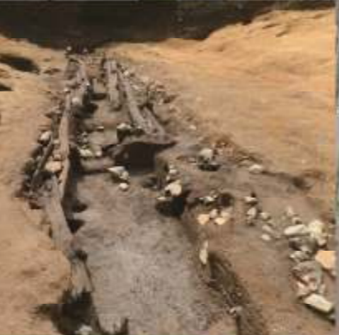
1区 水場の木組遺構(木の葉の水さらしなどで使われた)