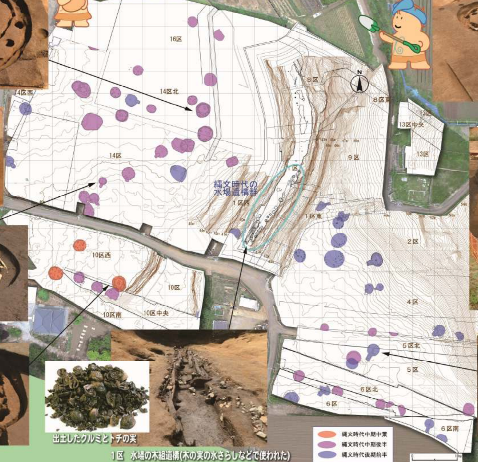
14区北 中期後半の竪穴住居跡