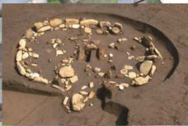
14区 中期後半の敷石住居跡