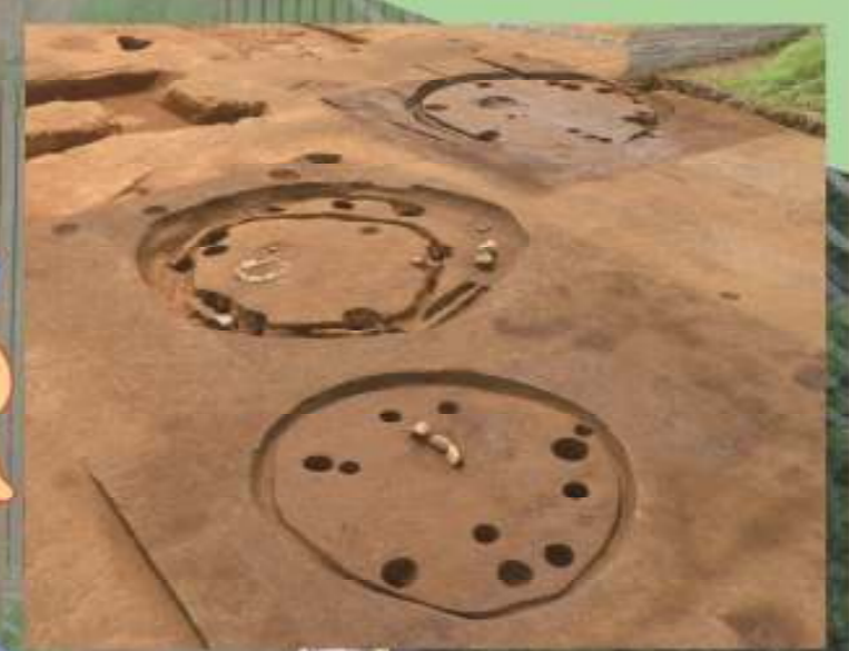
14区北 東側の竪穴住居跡群