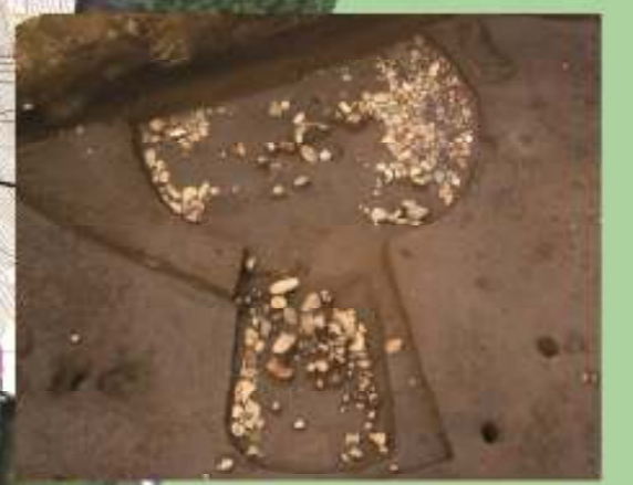
5区 後期前半の敷石住居跡