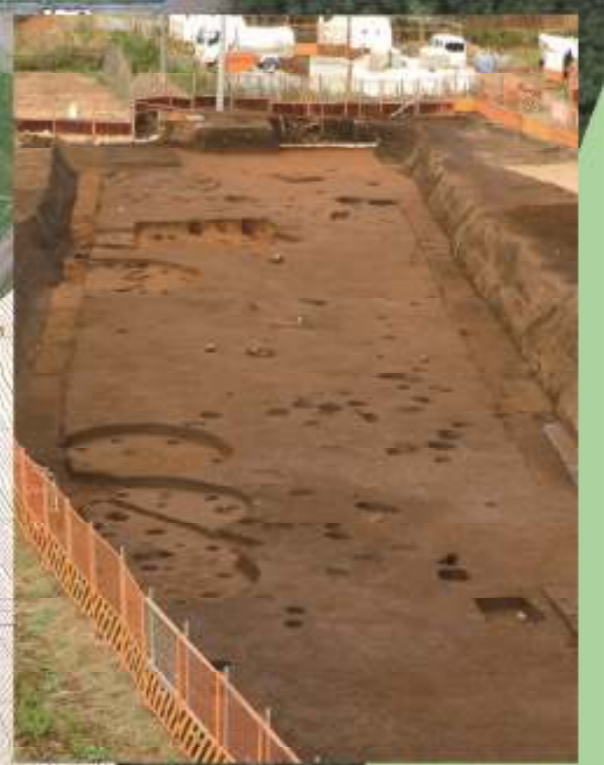
6区北 縄文時代全景