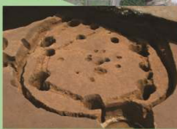
10区西 中期中葉の竪穴住居跡