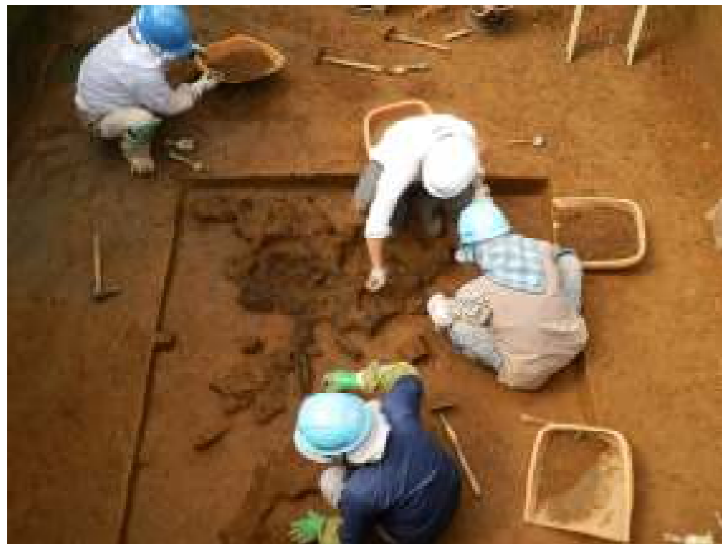
15区 旧石器炭化材調査状況

西富岡・向畑遺跡では、これまでの調査によって、中世の建物跡、古墳時代末から平安時代にかけての集落跡、縄文時代中期から後期にかけての台地上の集落跡、谷部からはクルミやトチの実などの堅果類が多数出土した水場遺構などが発見されており、たくさんの遺物が出土しています。今回は、旧石器時代と縄文時代の遺構・遺物を中心にこれまでの発掘調査の成果の一部を紹介します。