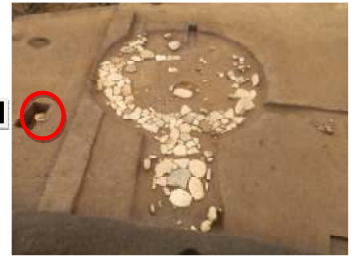
6区J11号敷石住居 全景