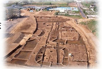
社家宇治山遺跡 方形周溝墓