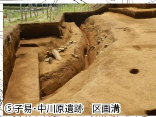
⑤子易・中川原遺跡 区画溝