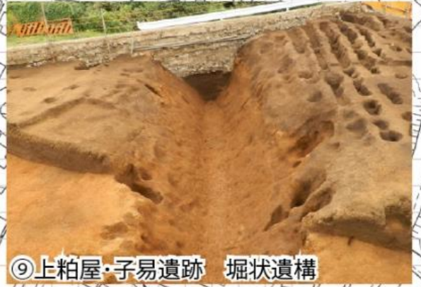
⑨上粕屋・子易遺跡 堀状遺構