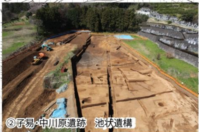
②子易・中川原遺跡 池状遺構