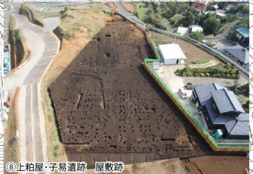
⑧上粕屋・子易遺跡 屋敷跡