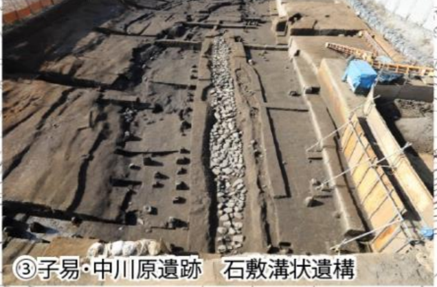
③子易・中川原遺跡 石敷溝状遺構