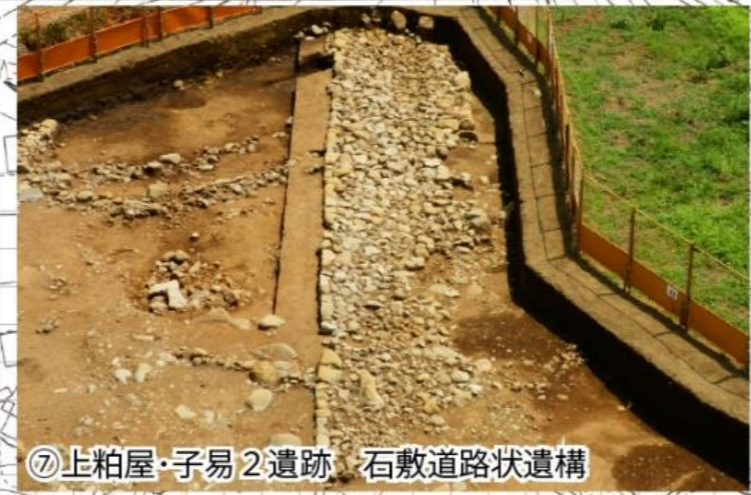
⑦上粕屋・子易2遺跡 石敷道路状遺構