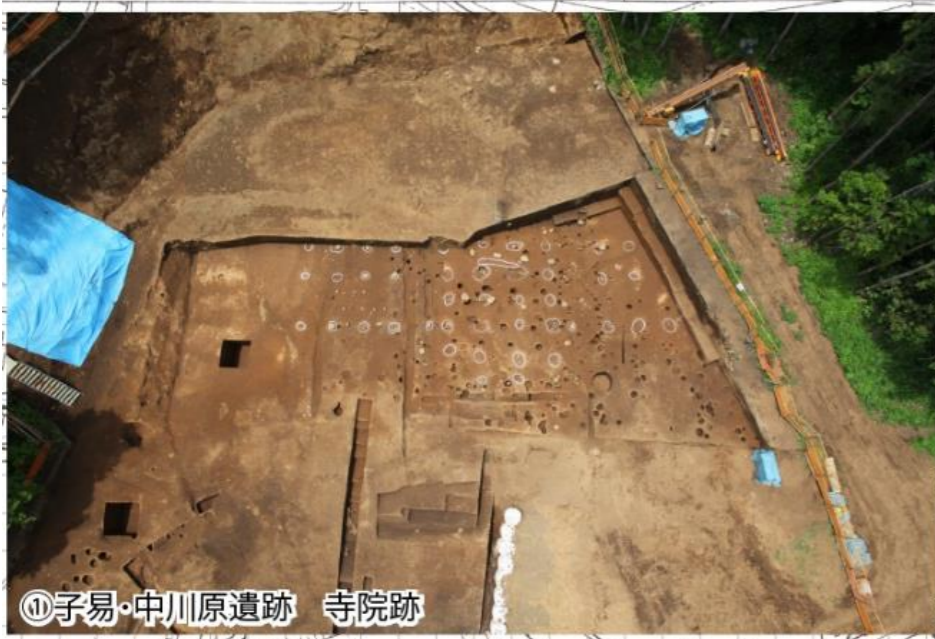
⑩子易・中川原遺跡 寺院跡