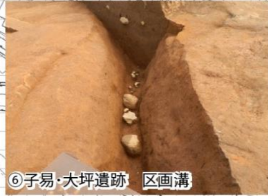
⑥子易・大坪遺跡 区画溝