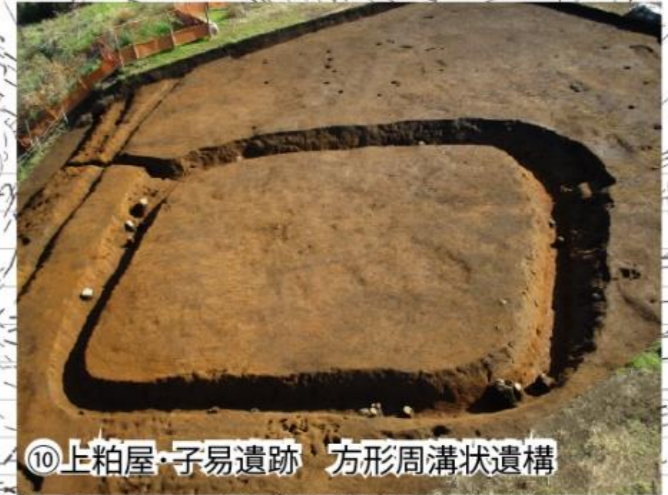
⑩上粕屋・子易遺跡 方形周溝状遺構