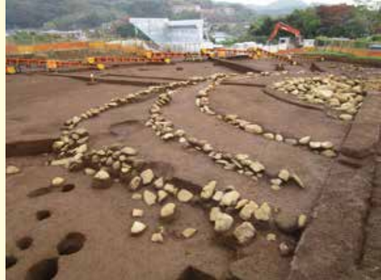
▲墳丘を外周する方形石積と内側で二重に巡る墳丘内石列 南西から