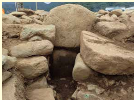
▲玄室(横穴式石室)の奥壁(2段積み) 南東から