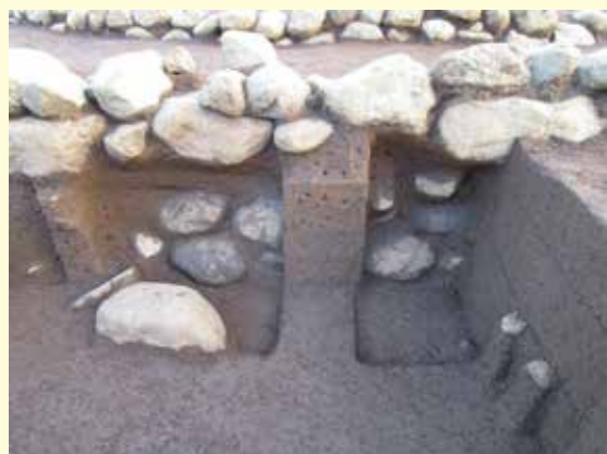
▲方形石積の基底部と墳丘内石列(外側)の基底部 北西から