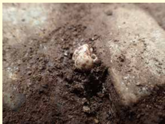
▲玄室(横穴式石室)の床面から検出された人骨(歯) 南東から