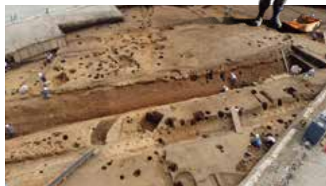
伊勢原市：西富岡・長竹遺跡（作業風景）