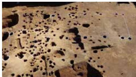
伊勢原市：上粕屋・秋山上遺跡（中世 掘立柱建物跡）