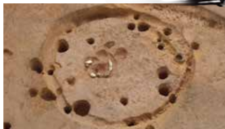
伊勢原市：西富岡・長竹遺跡（縄文時代 竪穴住居跡）