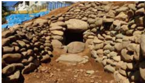
厚木市：中依知遺跡群（古墳時代 横穴墓）