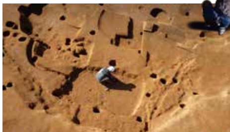
伊勢原市：西富岡・中島2遺跡（中世 竪穴状遺構 調査状況）

西富岡・中島2遺跡 西富岡・長竹遺跡 上粕屋・和田内下2遺跡 上粕屋・和田内遺跡 上粕屋・秋山遺跡 上粕屋・秋山上遺跡 神成松遺跡 上粕屋・石倉中遺跡 三ノ宮・上入増遺跡 三ノ宮・中尾根山遺跡