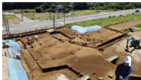
伊勢原市：神成松遺跡（作業風景）