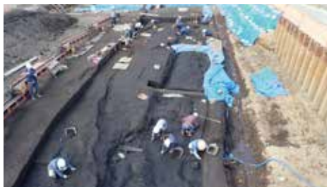
伊勢原市：上粕屋・和田内遺跡（作業風景）