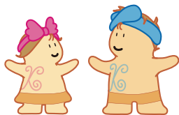
財団キャラクター はちくんとまきちゃん