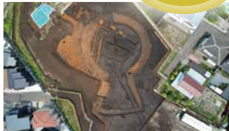
厚木市：及川伊勢宮遺跡（古墳時代 前方後円墳）