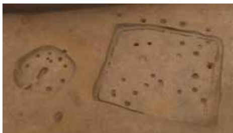
伊勢原市：三ノ宮・上入増遺跡（古墳時代 竪穴住居跡）