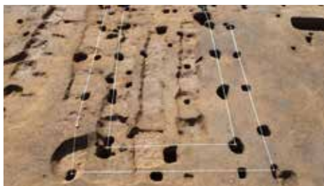
伊勢原市：西富岡・中島2遺跡（中世 掘立柱建物跡）